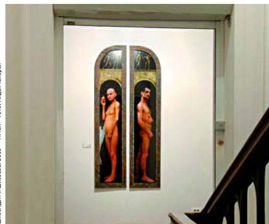
ШизоАдам и ШизоЕва. 2000. МКСИ.