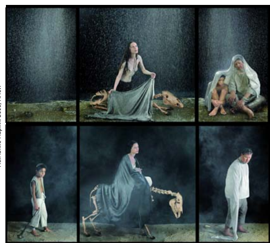
Молчание Марии. 2010. МКСИ